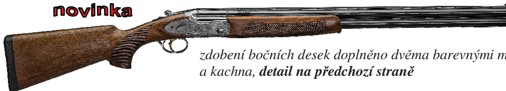
Diamond Lux color

zdobení bočních desek doplněno dvěma barevnými motivy - bažant a kachna, detail na předchozí straně